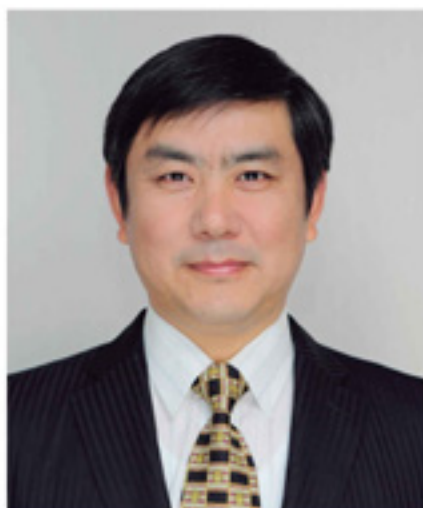
名古屋中国春節祭実行委員会 委員長