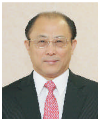
中華人民共和國 駐名古屋總領事館 總領事